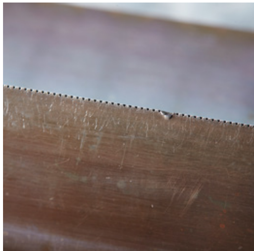
一块熔喷喷丝板翻新前/后的对比